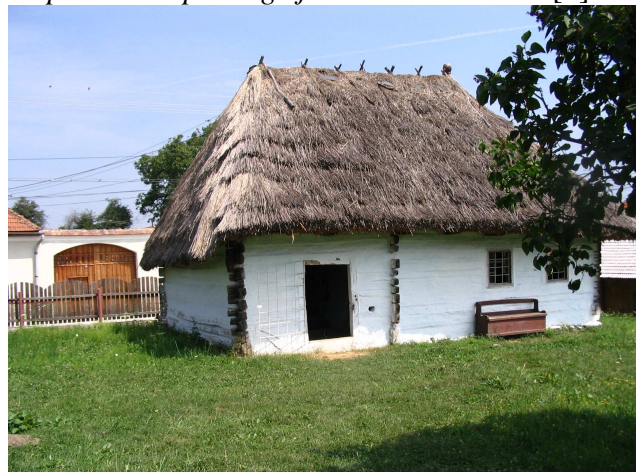
Fig.1 Muzeul Badea Cârțan

Cârțișoara, care reprezintă el însăși o resursă importantă pentru înțelegerea educației sanitare din acea perioadă, a importanței pe care o are promovarea sănătății încă din acea perioadă, știind că întotdeauna „Cultura și particularitățile epocii și-au pus întotdeauna amprenta asupra îngrijirilor de sănătate” [5].