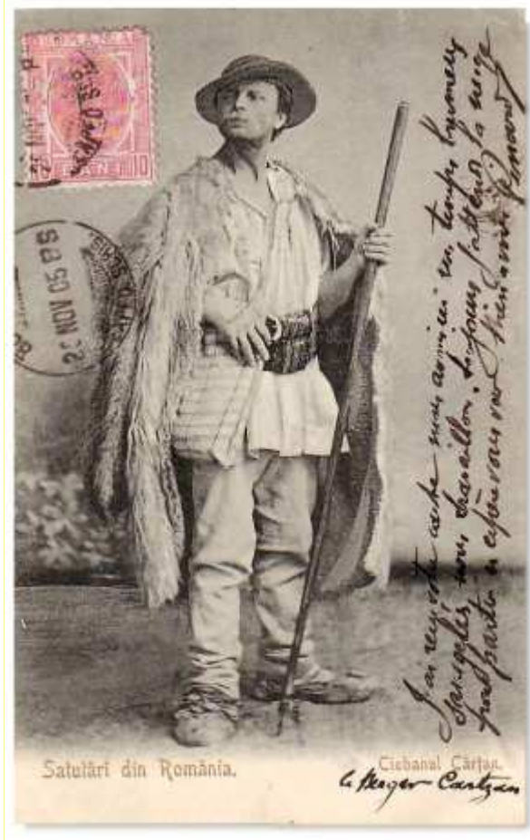
Fig.3 – Badea Cârțan

cărțile găsite în muzeu, ci își propune să aducă argumente privind importanța cărților alese de Badea Cârțan pentru educarea românilor din Transilvania.